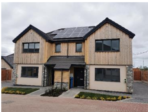
Ffigwr 1: Cynllun Clwyd Alyn yn Llanbedr Dyffryn Clwyd ©Clwyd Alyn